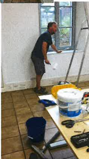
Une classe repeinte